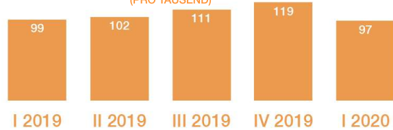
AUSGESCHRIEBENE POSITIONEN JE QUARTAL (PRO TAUSEND)

ONLINE AUSGESCHRIEBENE VERTRIEBSPOSITIONEN IM QUARTAL I 2020