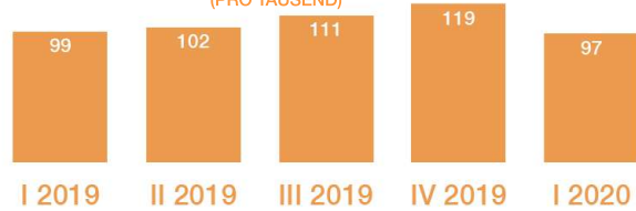
AUSGESCHRIEBENE POSITIONEN JE QUARTAL (PRO TAUSEND)

ONLINE AUSGESCHRIEBENE VERTRIEBSPOSITIONEN IM QUARTAL I 2020